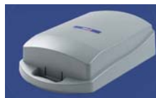
Capot de protection rigide. Assure une parfaite protection lors de vos déplacements